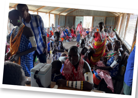
Bilde venstre: Lang kø for å besøke jeep-line sykepleier i Magadi!

Før forsøkte vi å hjelpe kvinnene med annet arbeid. Nå kan de komme til stasjonen å jobbe i trygge omgivelser og med bra lønn for arbeidet. Barna kan være på førskolen.