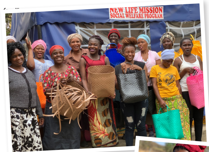
Bildet; Vi er så takknemlige for at noen trodde på oss og gav oss sjansen til å tjene penger til