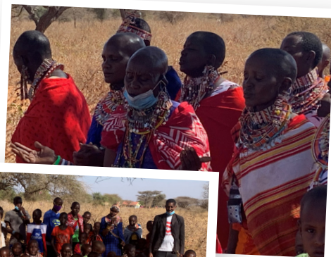
Bildene: Det er en fantastisk opplevelse å møte menigheten og møte folks enorme glede under åpen himmel.

Vi er så heldige at vi allerede har fått 2 gaver av 2 forskjellige ektepar som hver vil sponse med en ny kirke! Vil du også hjelpe menigheten med vedlikehold/oppradering? MERK DIN GAVE med "kirkebygg"