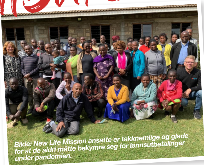
Bilde: New Life Mission ansatte er takknemlige og glade for at de aldri måtte bekymre seg for lønnsutbetalinger under pandemien.