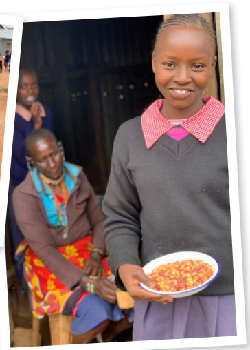
Bildene: Behovet akkurat nå er matutdeling! For 200kr kan en elev få skolelunsj i tre måneder. Måltidet gjør også at de faktisk kommer på skolen.

Sammen med lærerne og barna samles vi på en av skolene i Mashuru. Vi diskuterer betydningen av to år uten regn. En tørke som har hatt store negative konsekvenser for alt liv. Kommuneledelsen er presset og klarer ikke å utføre sin oppgave med å gi elevene skolemat (mais og bønner.)