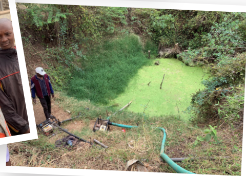
Bildene: Gammelt vannhull (bildet til høyre) Fantastisk å se barna skynde seg ut av klasserommene for å se hvordan vannet spruter ut av borehullet. Nå har hverdagen deres endret seg for alltid!

NLM sponses av Promotek IT-løsninger til bedrifter. www.promotek.no