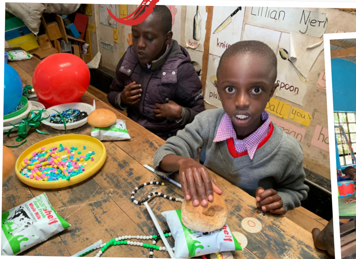
Elevene på spesialskolen setter stor pris på å leke med pedagogiske verktøy